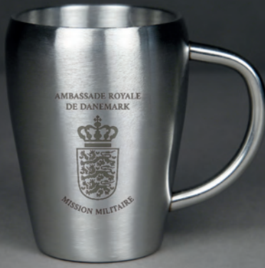
Tasse Dilley réf. : NGTA006

En acier inoxydable 18/8, finition mate, double paroi. Contenance : 0.20 l. Livrée en boîte cartonnée. Poids : 160 g Dimensions : Ø 7 x 9,5 cm